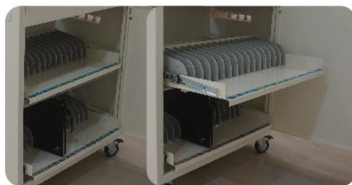
↑可抽拉式載具收納層